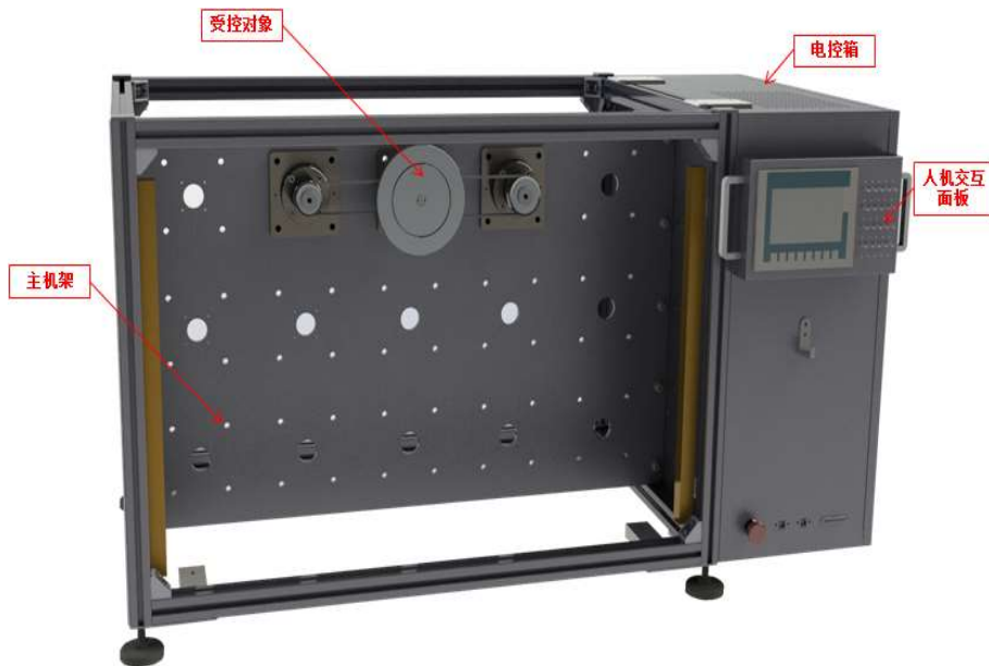
图 1-1 多功能运动控制实训平台主要组成部分

本赛项所用多功能运动控制平台主要由主机架、控制系统电控箱、人机交互面板以及受控对象组等几部分组成，示意图图 1-1 所示：